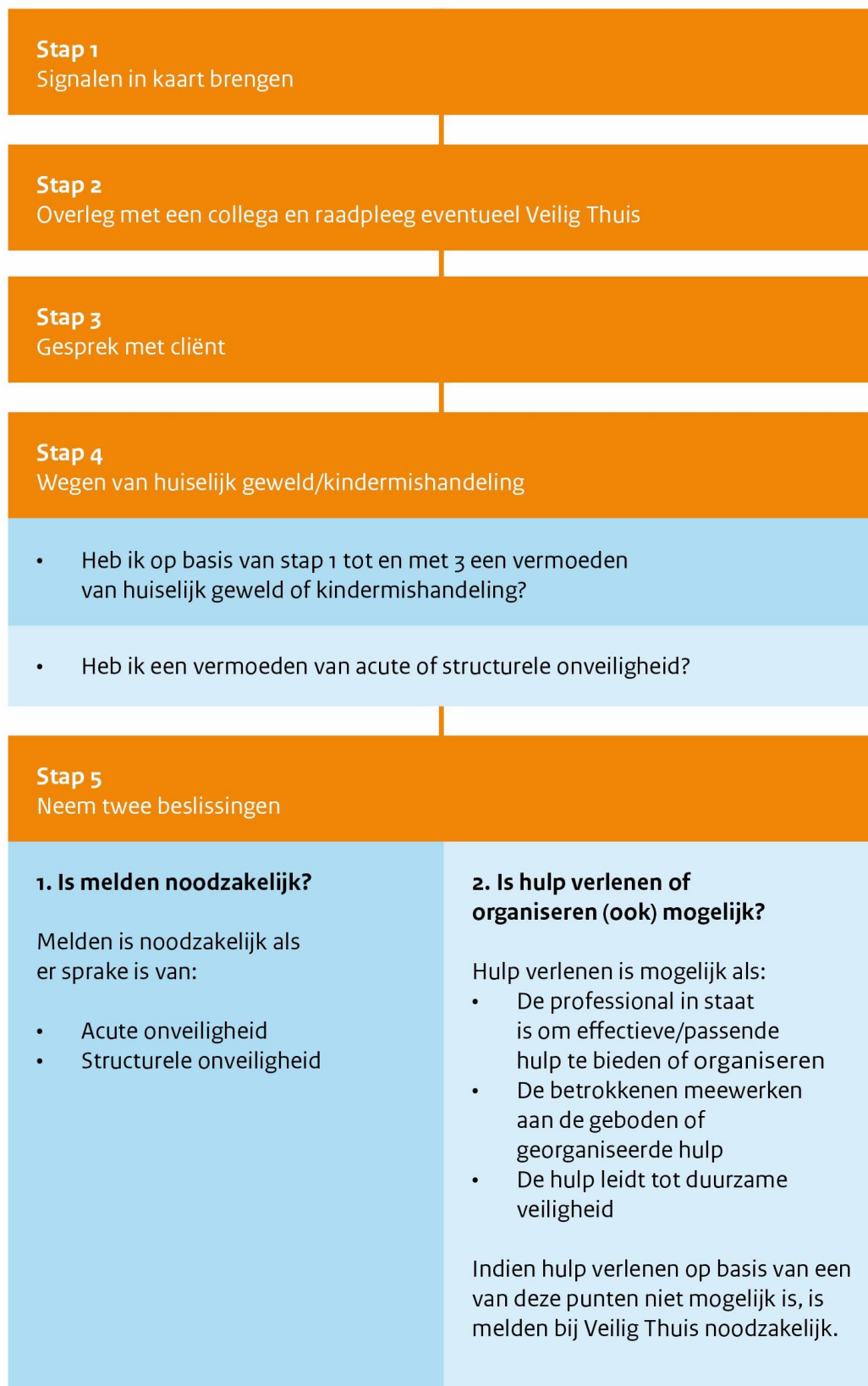
Figuur 1: Stappenplan verbeterde meldcode